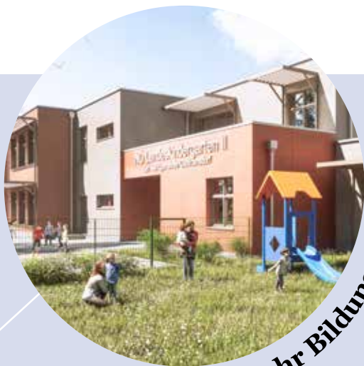
Noch mehr Bildung