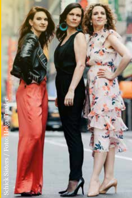
Schick Sisters