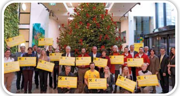
Foto: Alle 20 Preisträger unter dem großen Christbaum der RRB Mödling